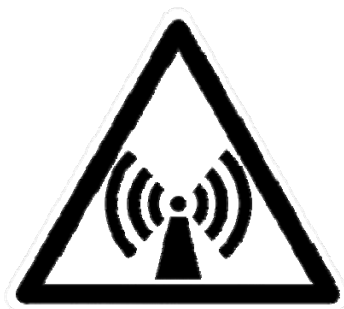
Símbolo ou pictograma